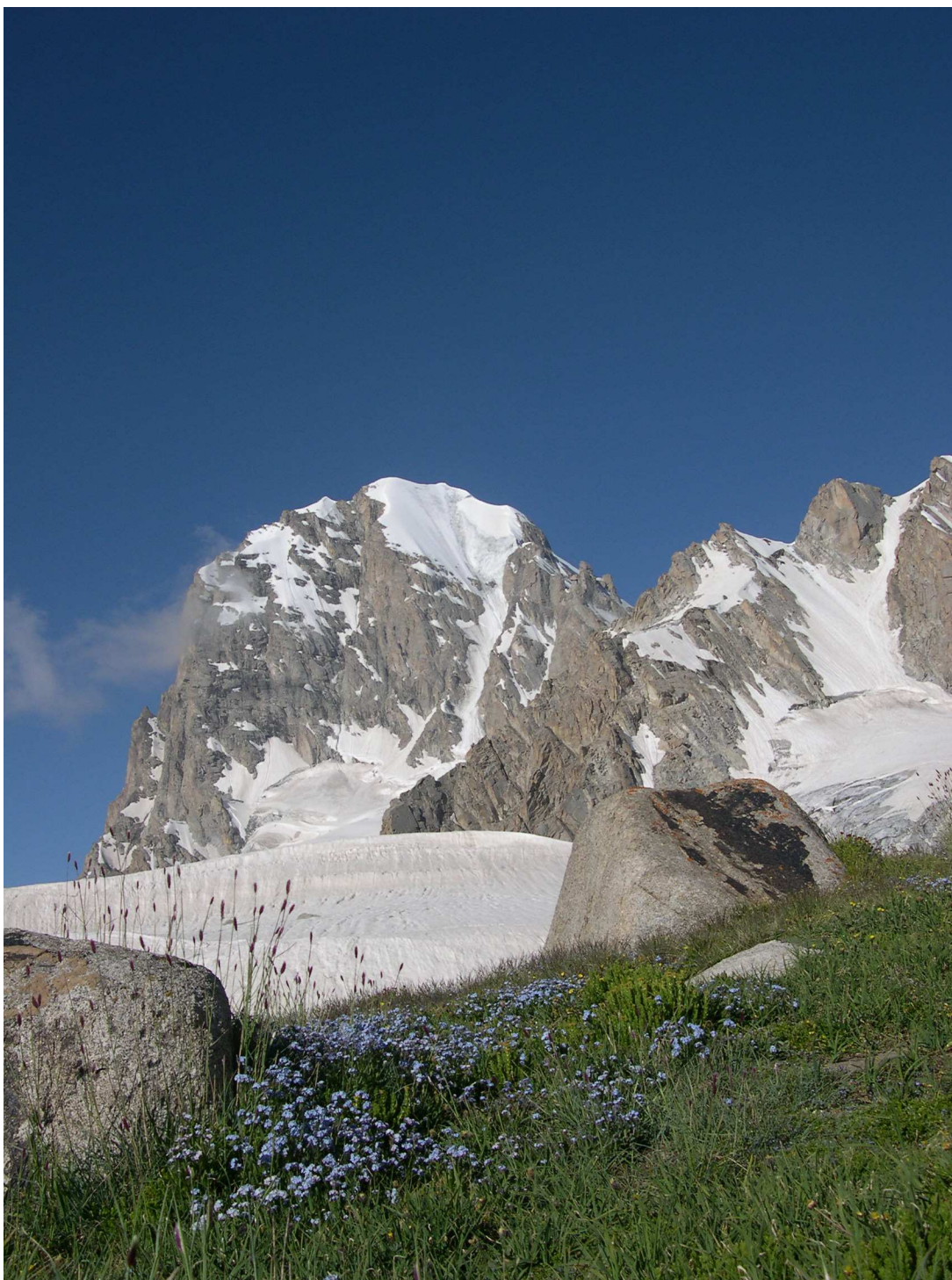
Фото 4: Гора Мечта (Ходжалокан)