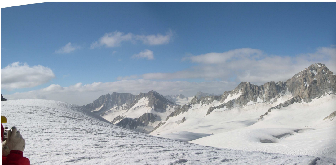
Фото 11: Ледник Сиама