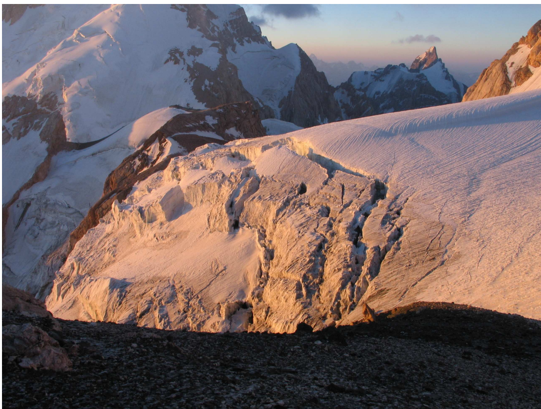
Фото 45: Плато Ганзы с Западного седла Гусева-Мухина