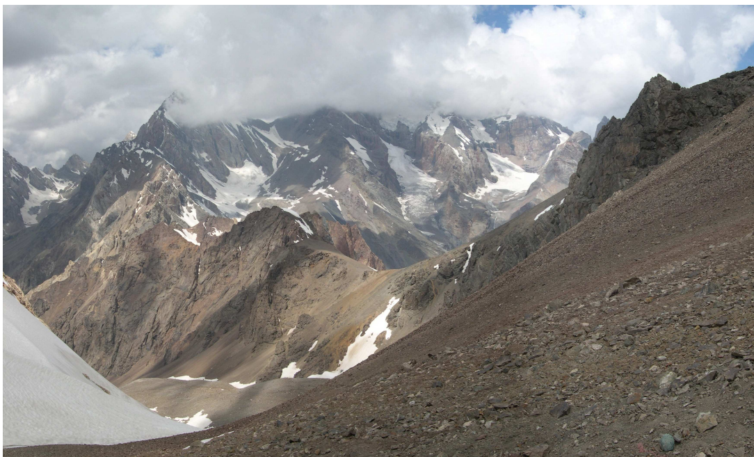
Фото 49: Северная седловина перевала ВАА с южной