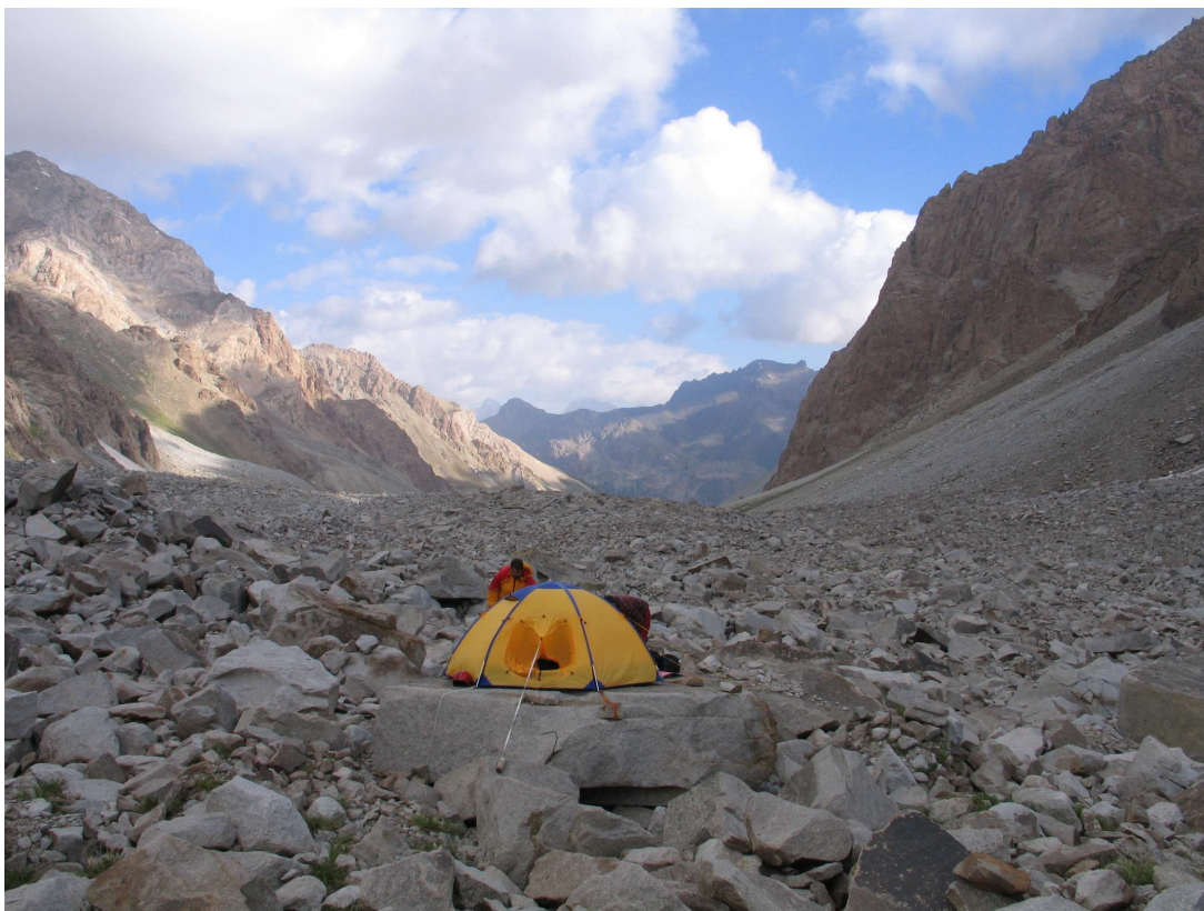
Фото 31: Бивак на камне