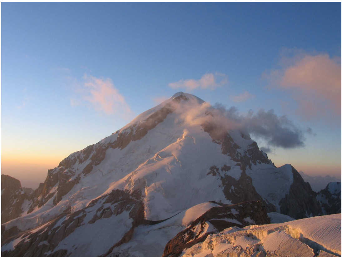
Фото 44: Большая Ганза с Западного седла Гусева-Мухина