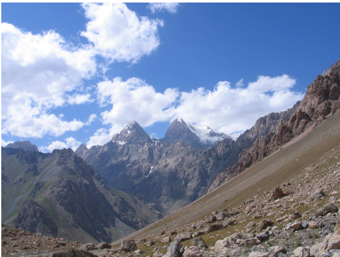
Фото 35: Энергия и Чимтарга из верховьев Сувтора