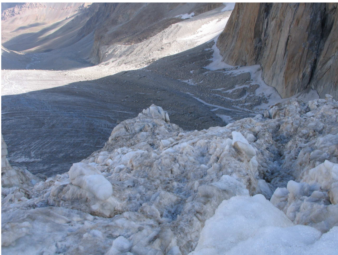
Фото 21: В ледопаде ледника Рохиб