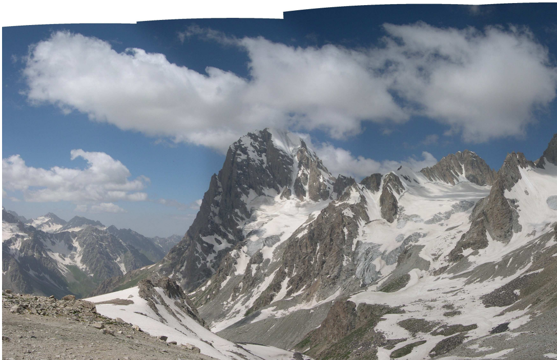
Фото 7: Панорама с перевала Четырех