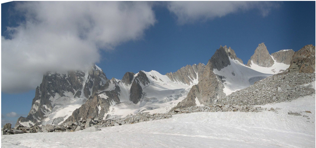
Фото 5: Панорама верховьев Кадимташа