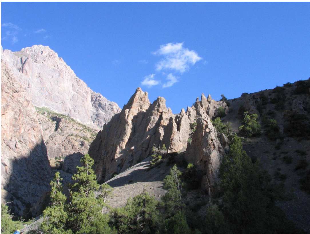
Фото 34: Каменные останцы в ущелье Арха