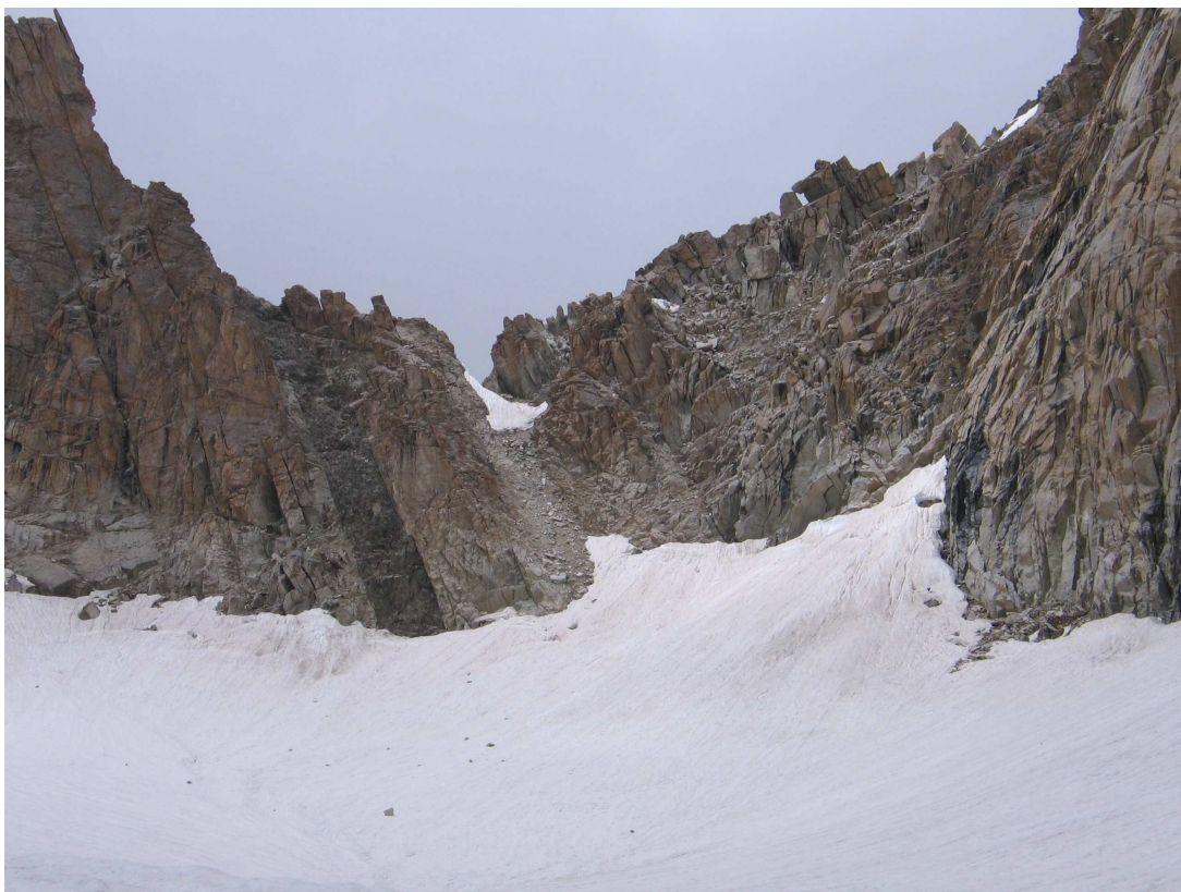
Фото 28: Подъем на перевал Птичий с ЮВ