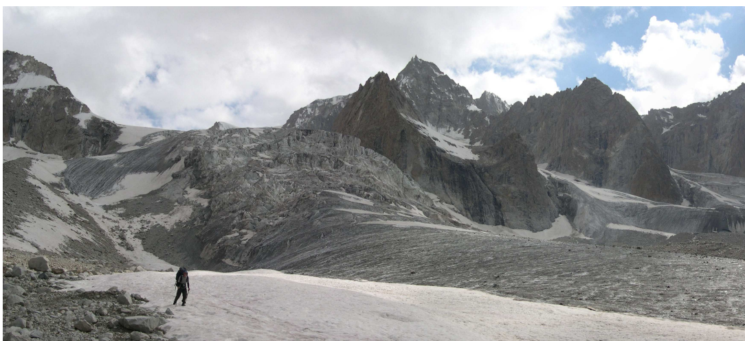
Фото 16: Ледопад и язык ледника Бахадур