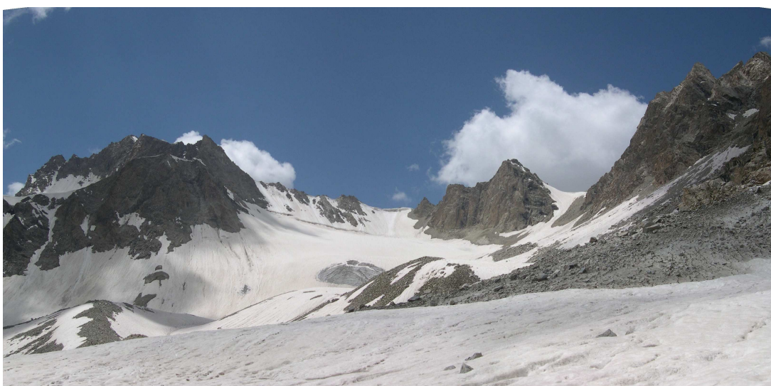
Фото 10: Перевал Четырех со стороны Сиамы