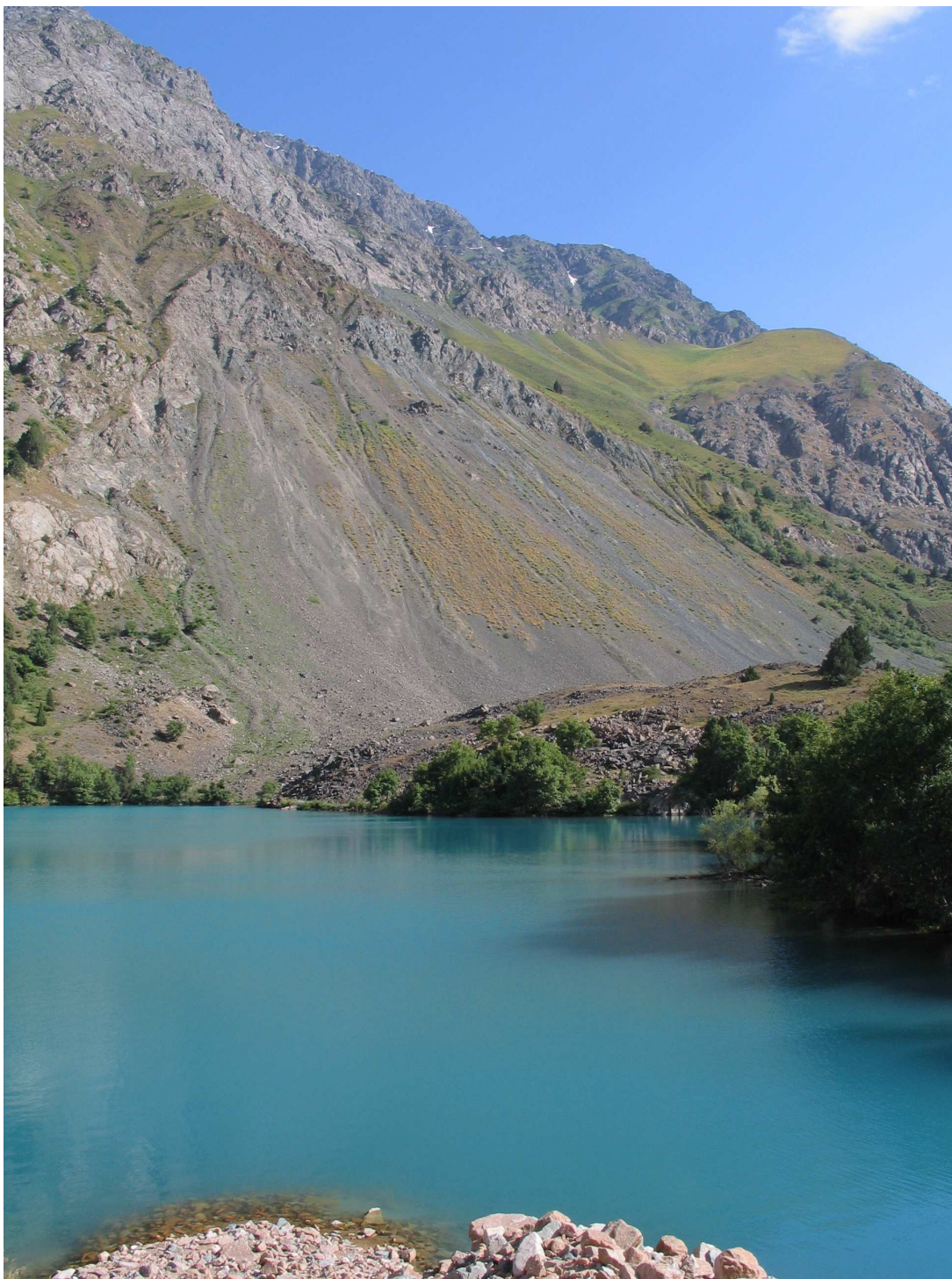
Фото 3: Озеро Пайрон