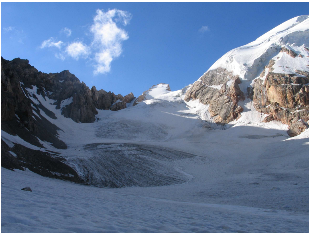
Фото 46: Ледник Малой Ганзы, спуск с Западного седла перевала Гусева-Мухина