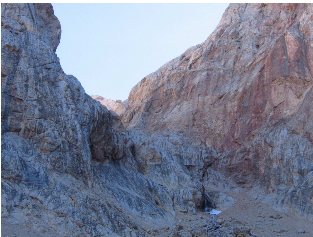
Фото 36: Подъем на перевал Седло Ганзы с юга