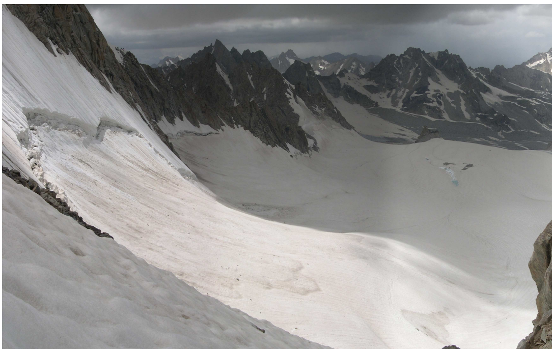
Фото 29: Вид с перевала Птичий на СЗ