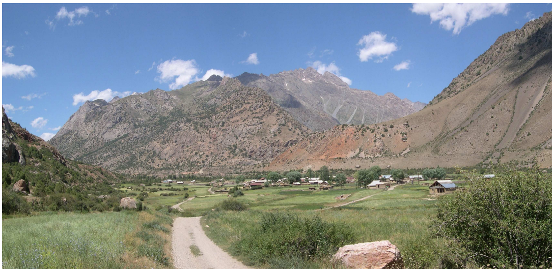
Фото 32: Кишлак Сарытаг