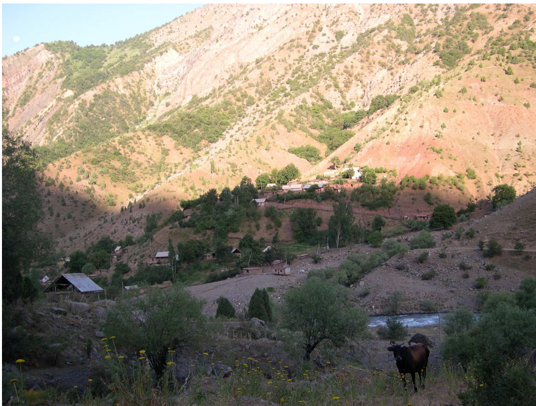
Фото 1: Кишлак Хакими