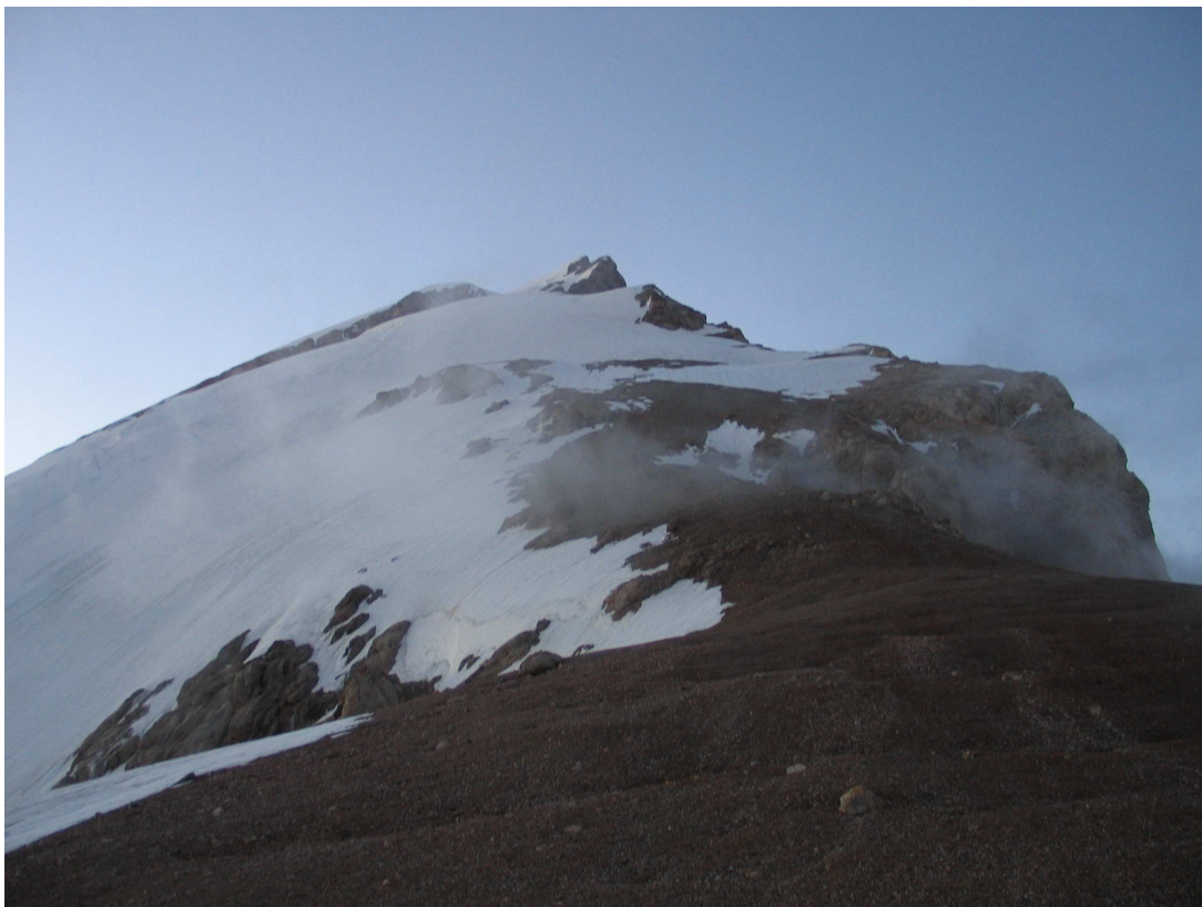
Фото 39: Перевал Седло Ганзы, начало подъема на Большую Ганзу