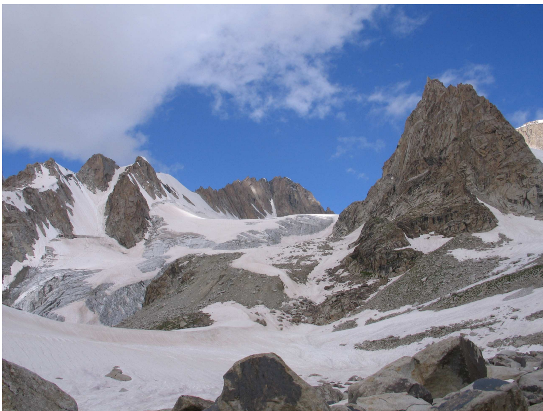
Фото 27: Начало подъема на перевал Птичий