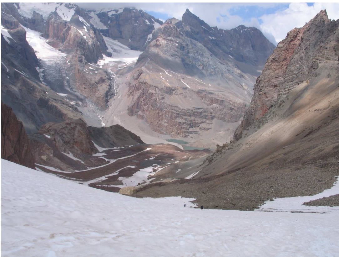
Фото 51: Спуск с перевала ВАА к Мутным озерам