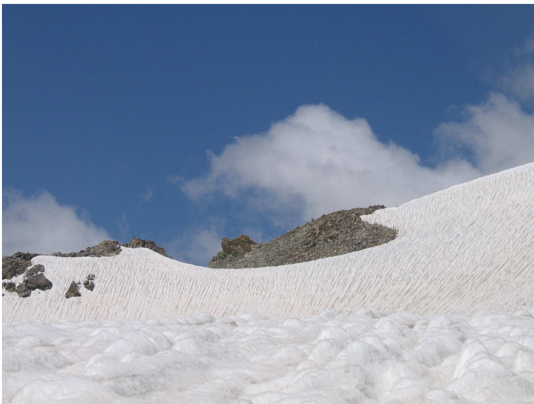
Фото 13: Начало спуска с перевала Сиама