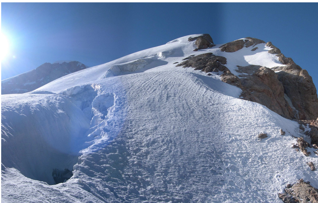
Фото 41: Средняя часть гребня Большой Ганзы