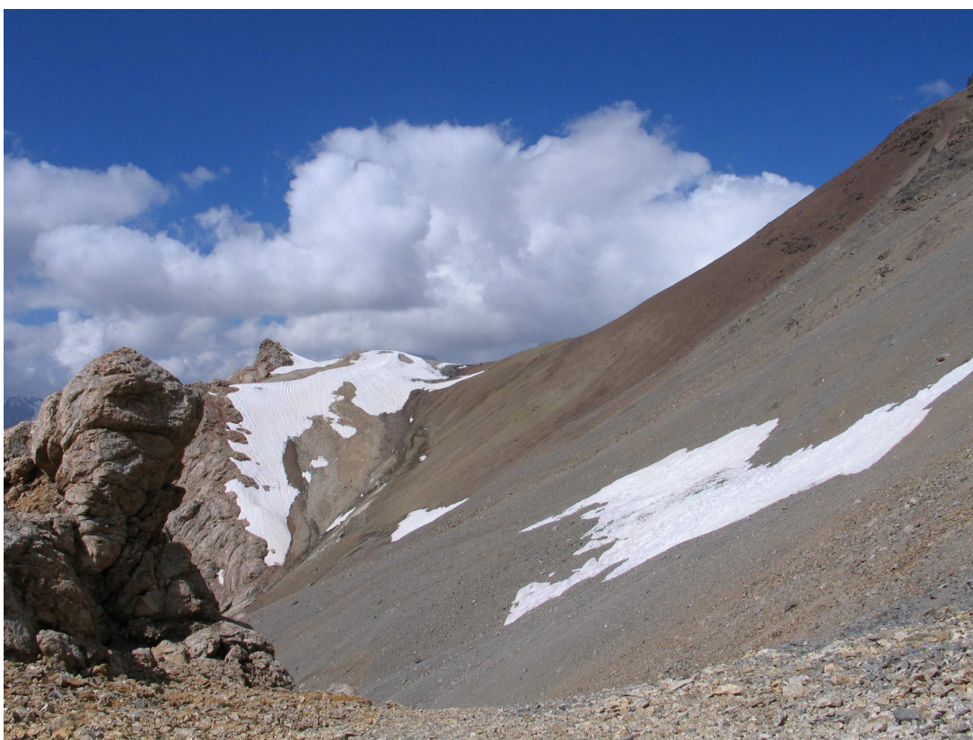
Фото 48: Траверс осыпного склона между первой и второй южными седловинами перевала ВАА