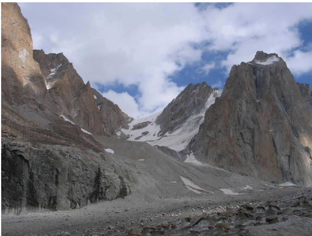
Фото 19: Перевал Харьковского политехнического института