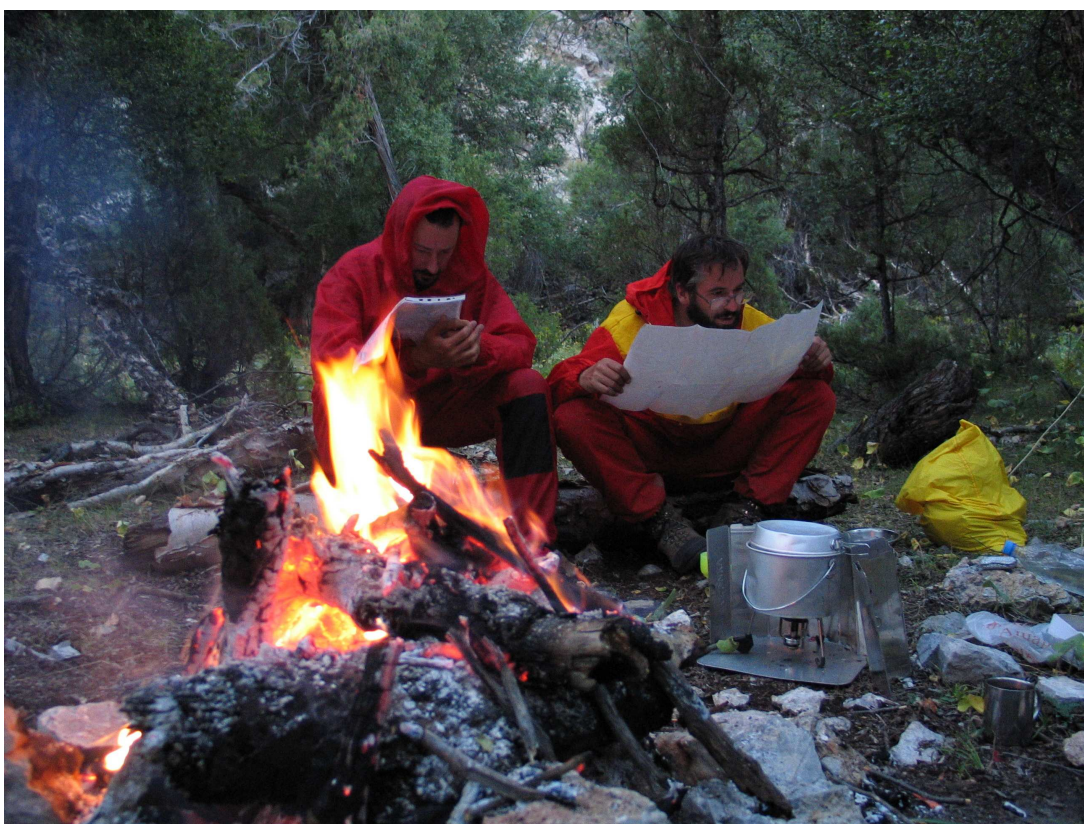
Фото 33: Ночуем в лесу в ущелье Арха