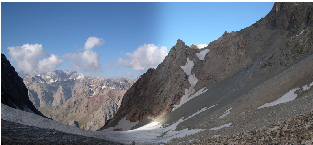
Фото 47: Подъем на перевал ВАА с ледника Малой Ганзы