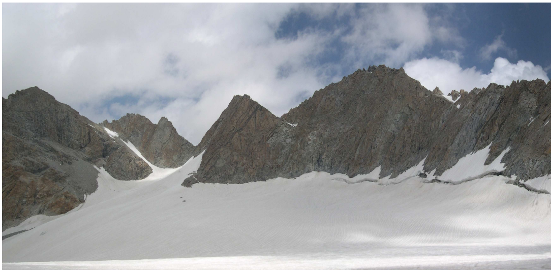
Фото 24: Панорама верховьев ледника Рохиб