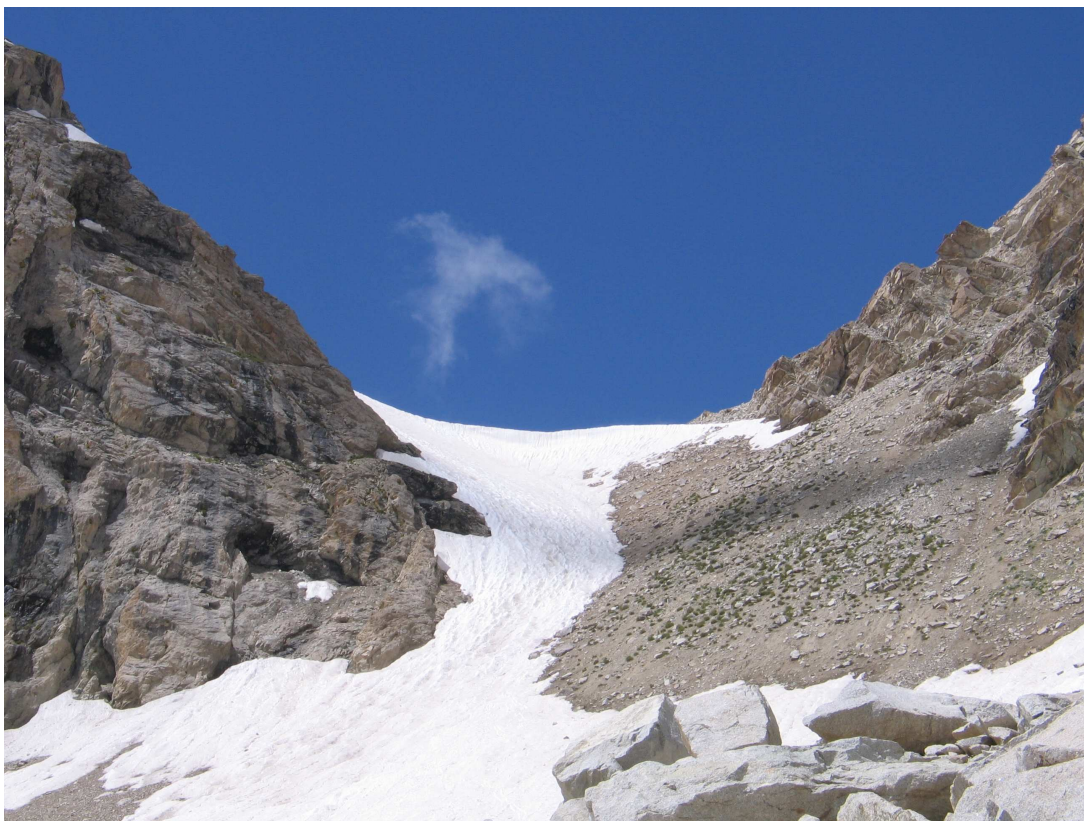
Фото 9: Спуск с перевала Четырех