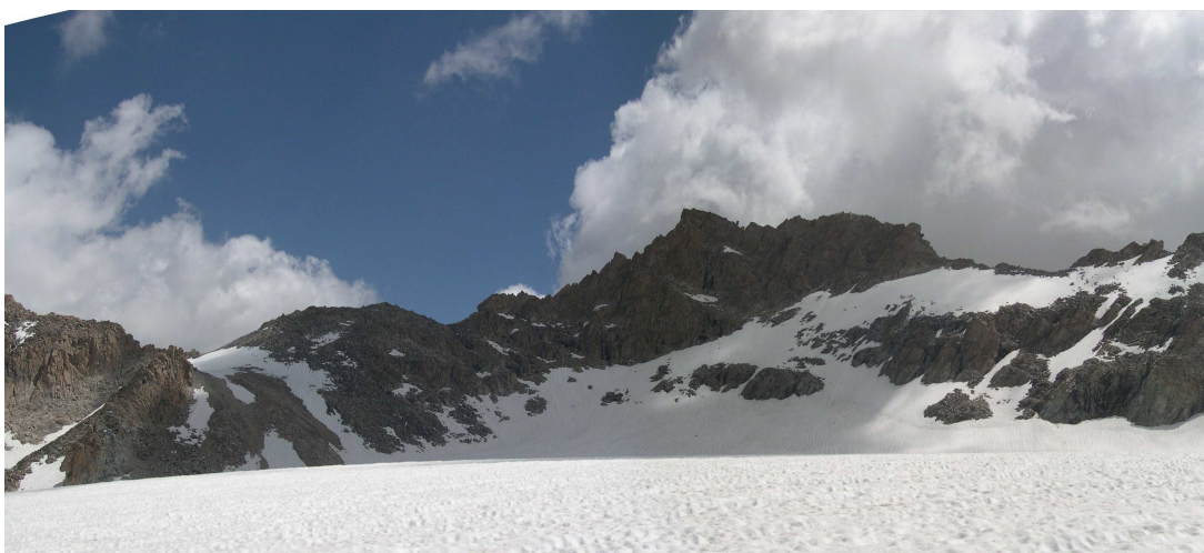
Фото 14: Панорама верховьев ледника Бахадур