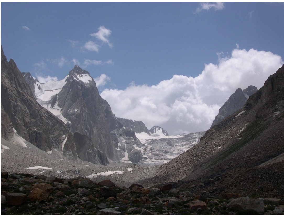
Фото 18: Ледопад ледника Рохиб