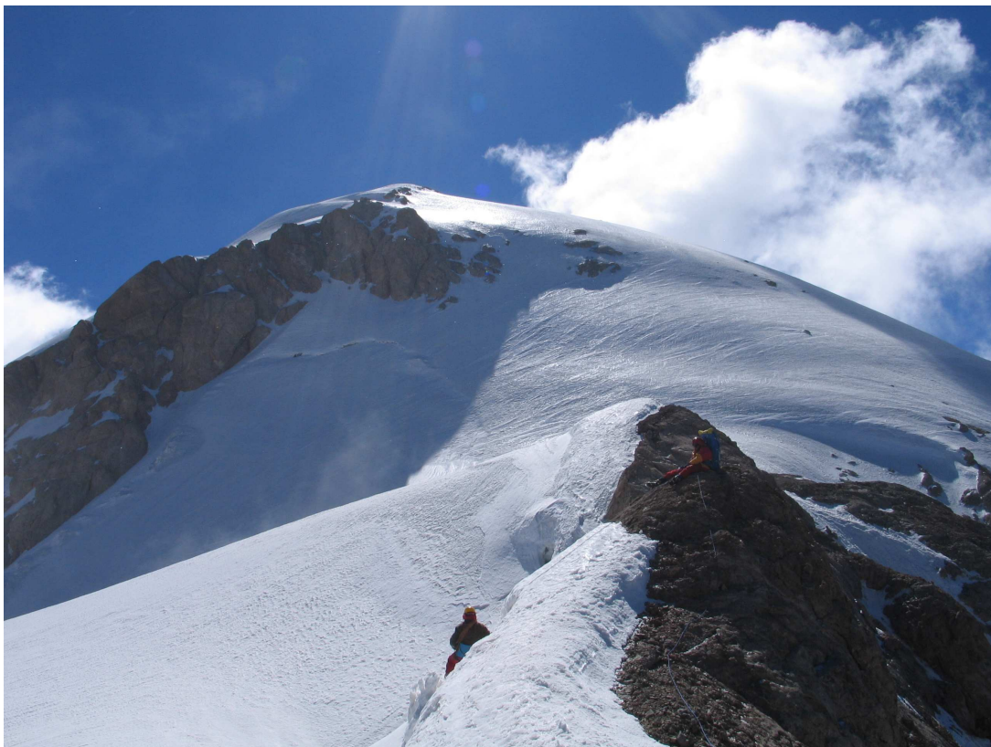
Фото 42: Вершина Большой Ганзы