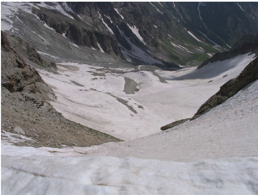
Фото 8: Долина Сиамы с перевала Четырех