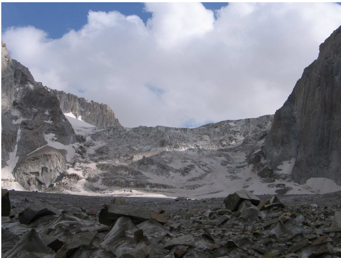
Фото 20: Ледопад ледника Рохиб