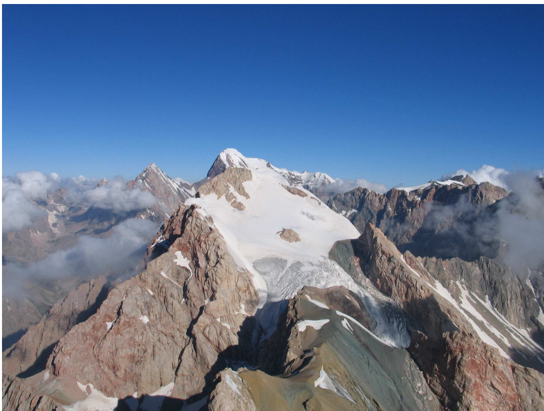
Фото 40: Малая Ганза, Энергия, Чимтарга с гребня Большой Ганзы