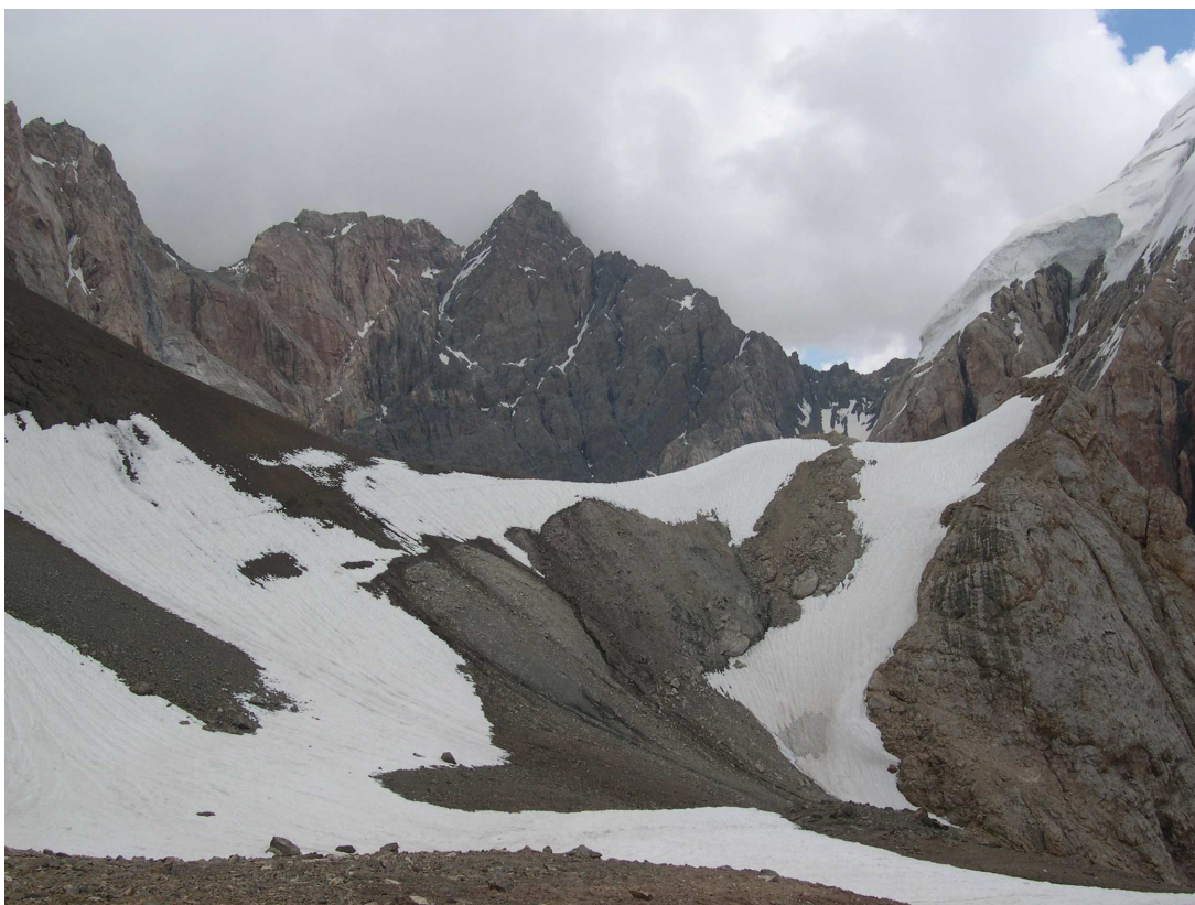
Фото 50: Южная седловина перевала ВАА с северной