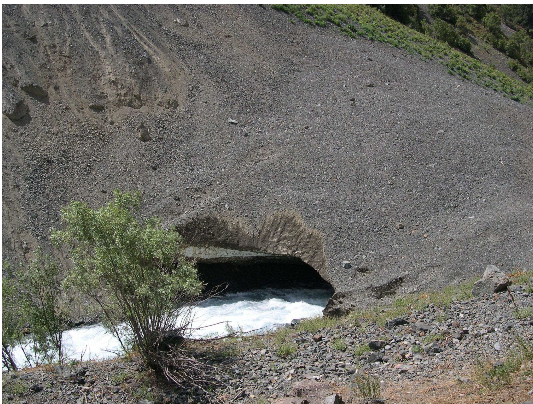
Фото 2: Лавинный конус – снежный мост через Пайрон