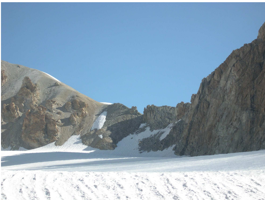
Фото 12: Подъем на перевал Сиама