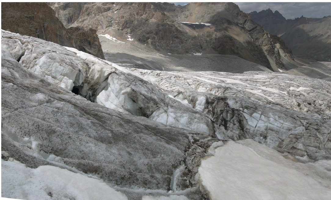
Фото 15: Ледопад ледника Бахадур