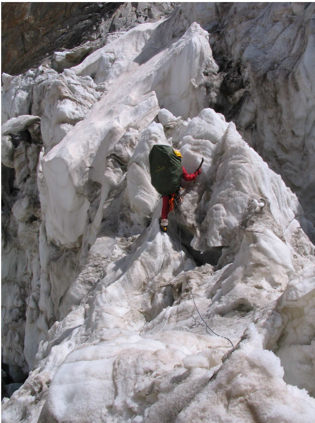
Фото 23: Прохождение ледового моста через разлом