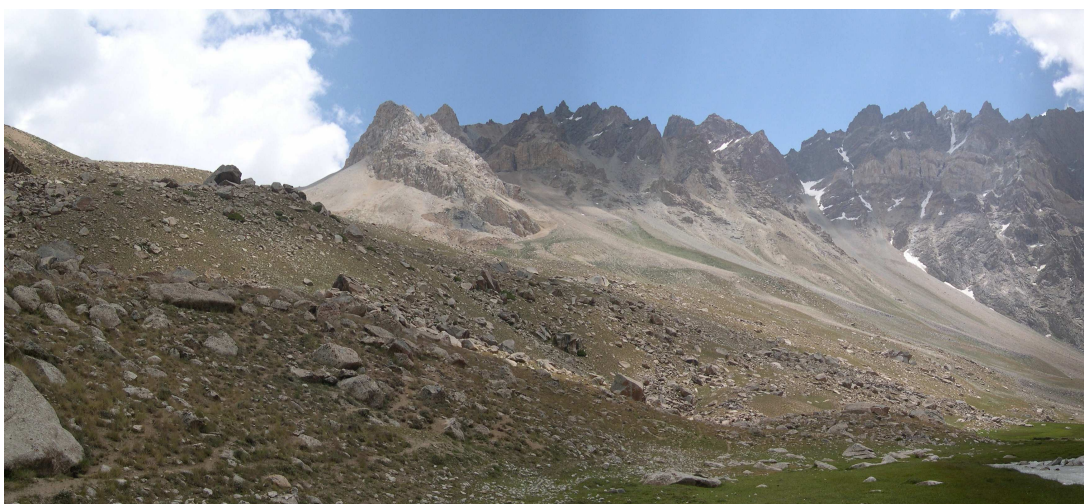
Фото 17: Долина реки Рохиб