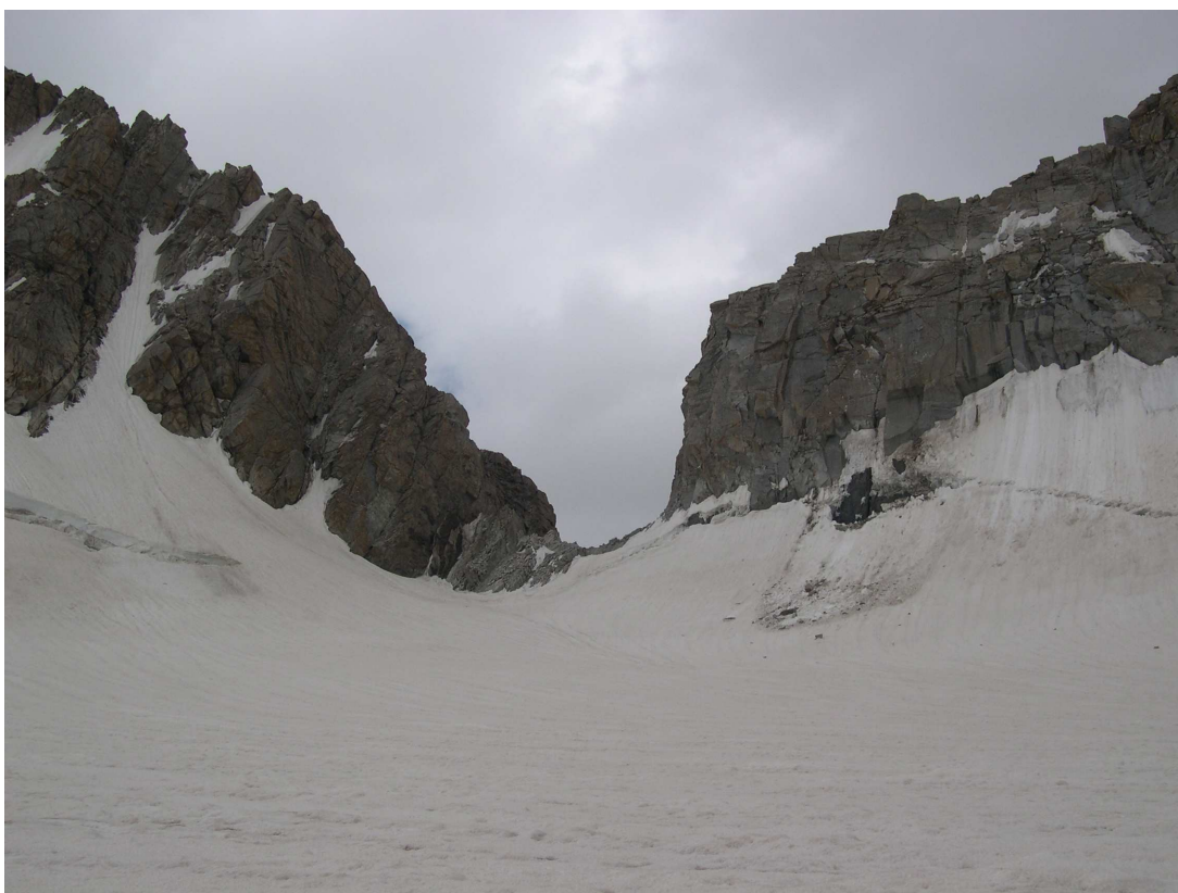
Фото 25: Седловина перевала Рохиб (Золотые Ворота) с севера