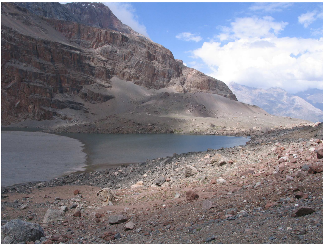
Фото 52: Мутное озеро