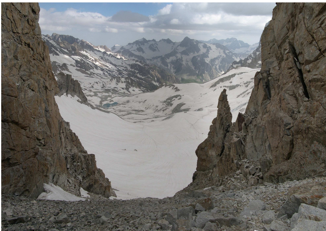
Фото 26: Вид с перевала Рохиб на юг