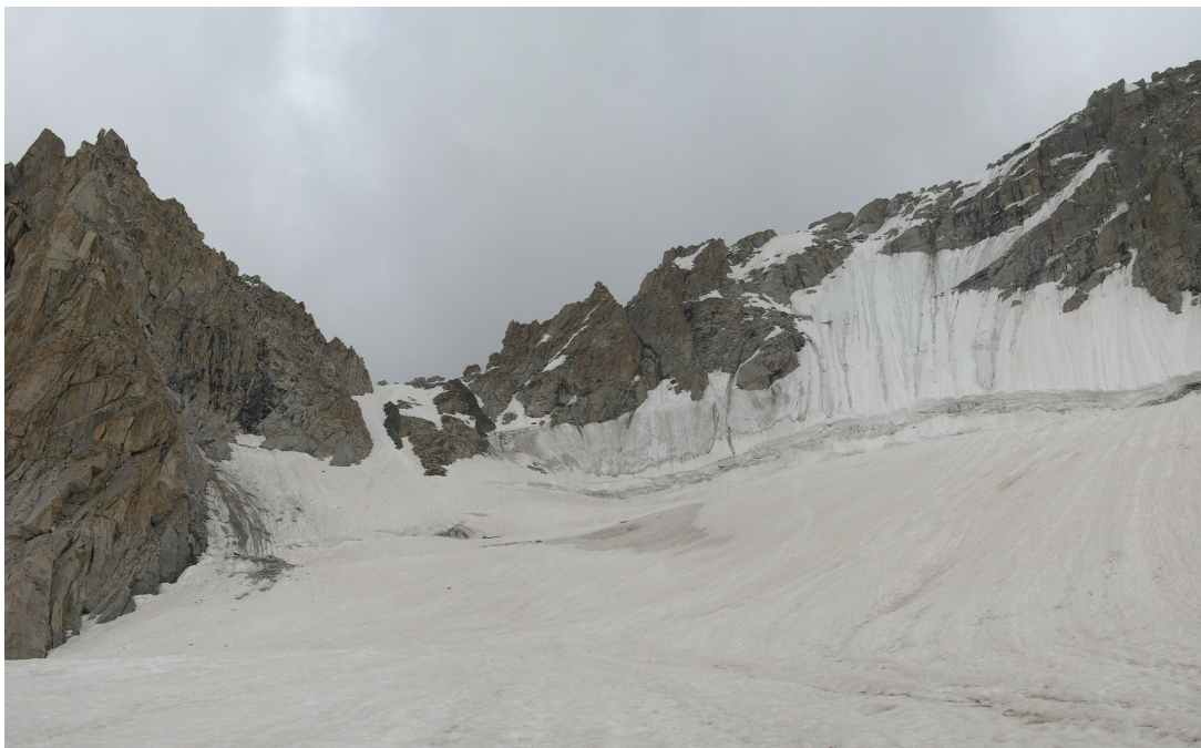
Фото 30: Спуск с перевала Птичий на СЗ