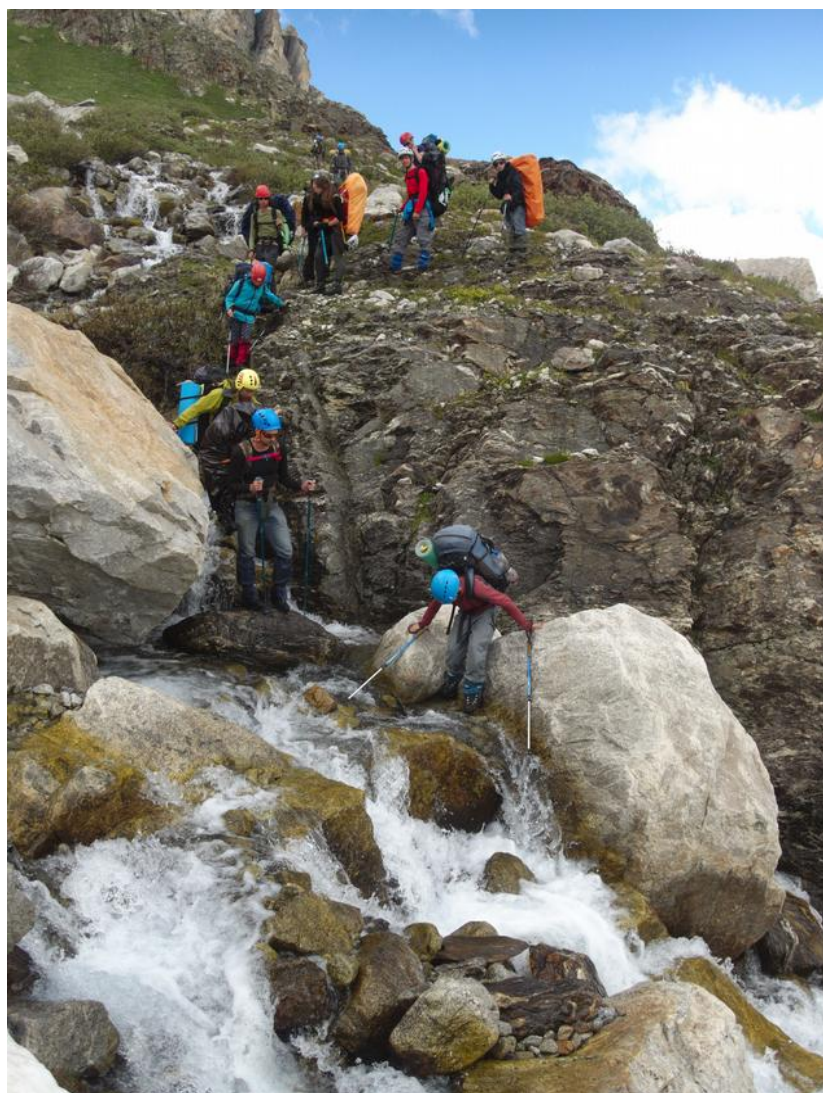
Фото 23. Переходим ручей