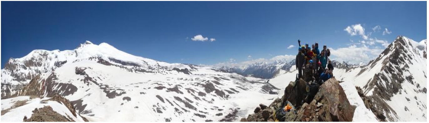
Фото 28. На узловой вершине рядом с пер. Хотютау