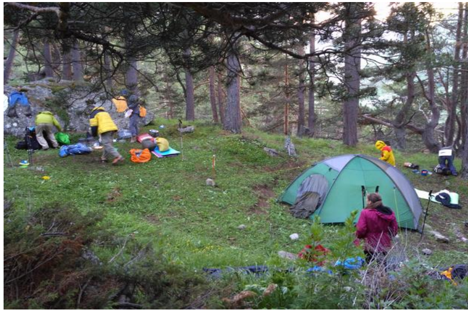
Фото 9. Стоянка