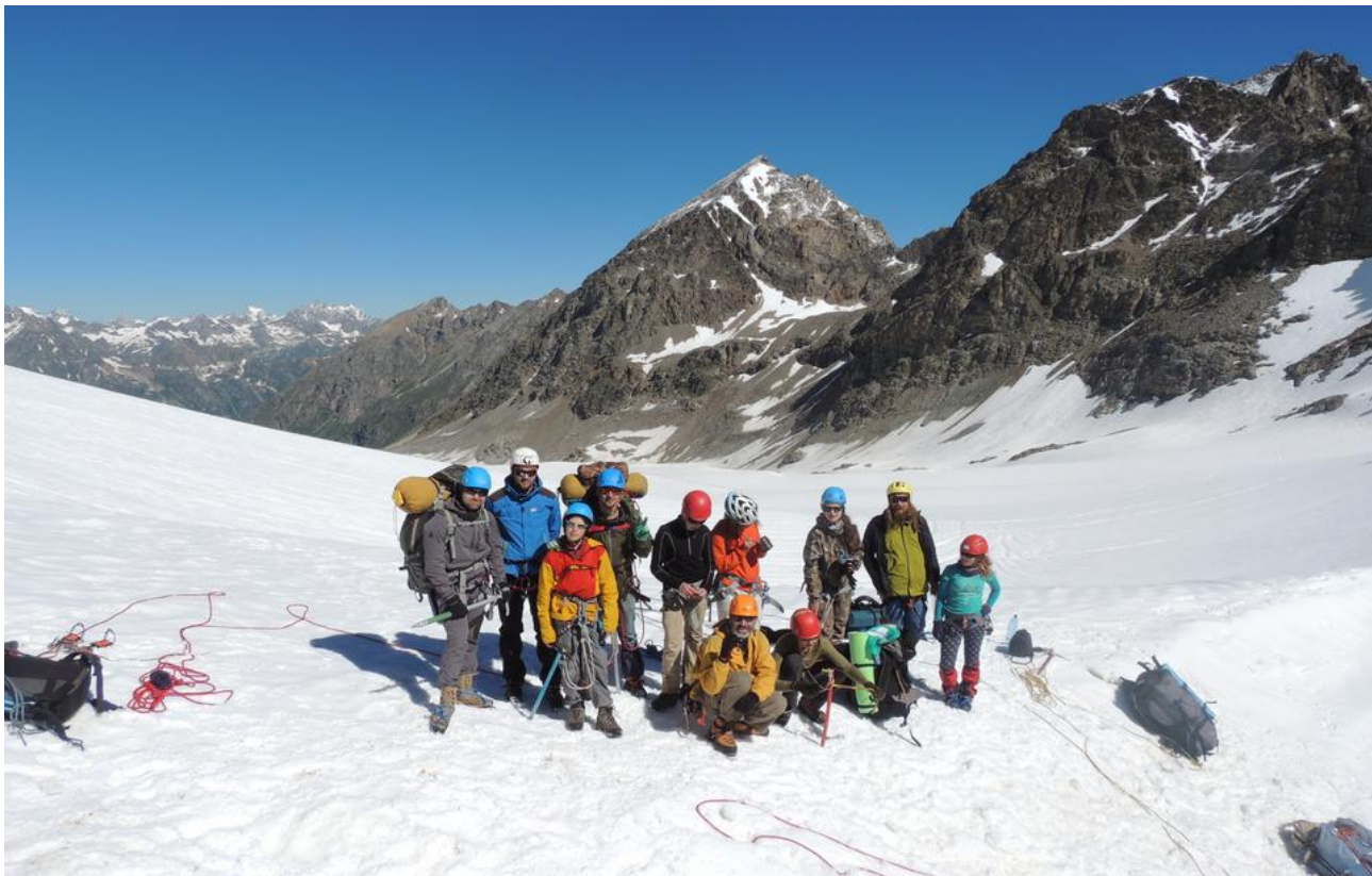
Фото 14. На перевале Ак-Тёбе