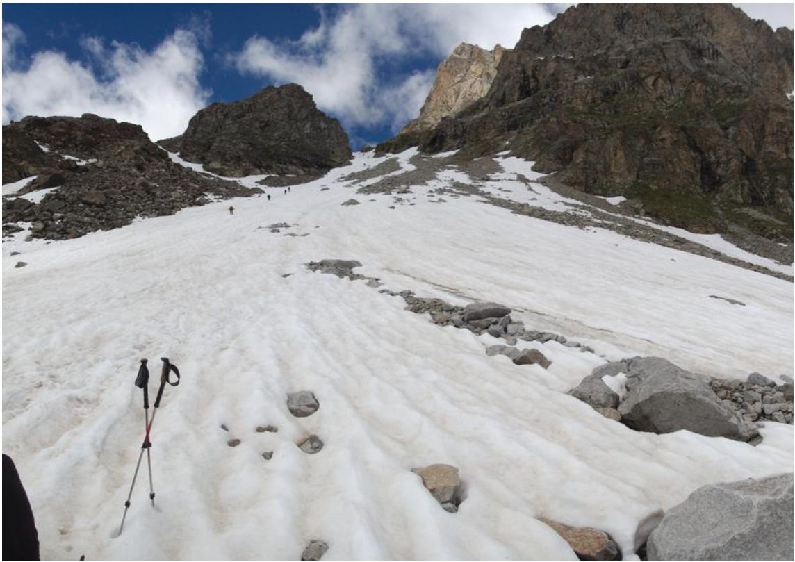
Фото 22. Спуск с перевала Доломиты Южный

Спуск начали в 11:30. Сверху путь выглядит довольно простым, начали спуск без ледорубов, только с палками. Но вскоре склон становится круче, достаем ледорубы. Кое-где под снегом лед — скользко. Некоторым участникам страшно и они спускаются довольно медленно, временами участники падают, но уверенно самострахуются при помощи ледорубов. Спустившись на 600 м, в 13:40 встаем на обед.