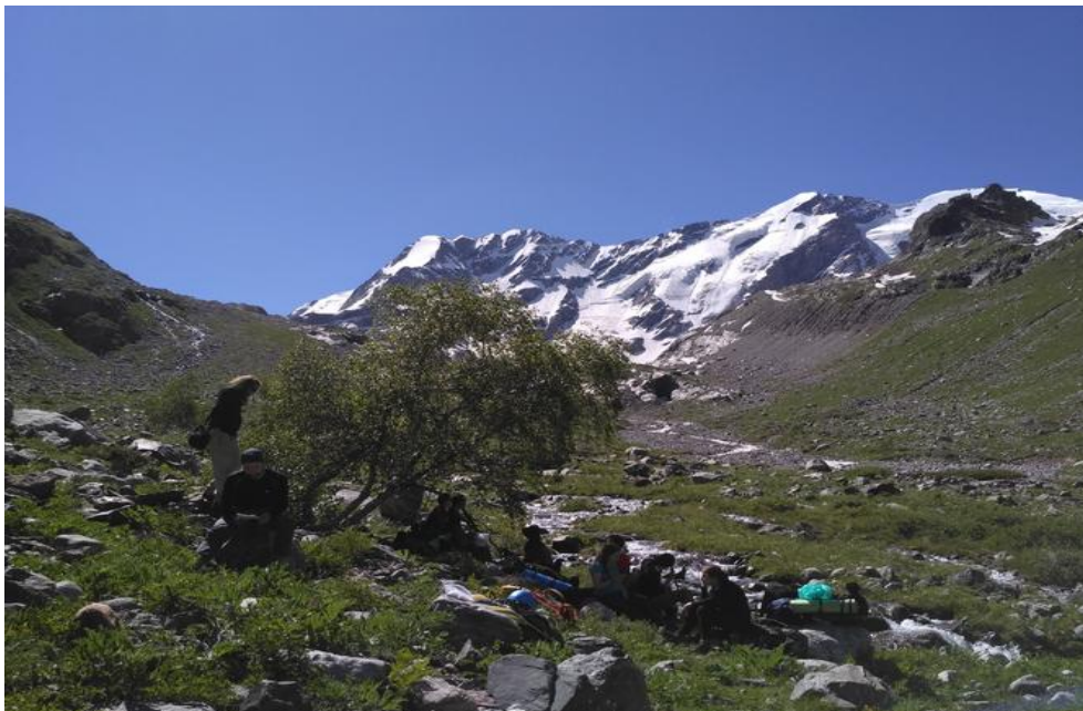
Фото 11. Перед подъемом на моренный вал.