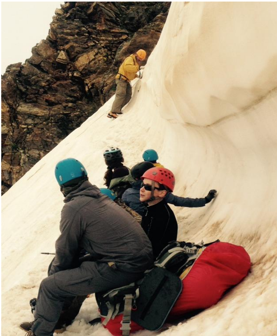
Фото 5. Ожидание перил.