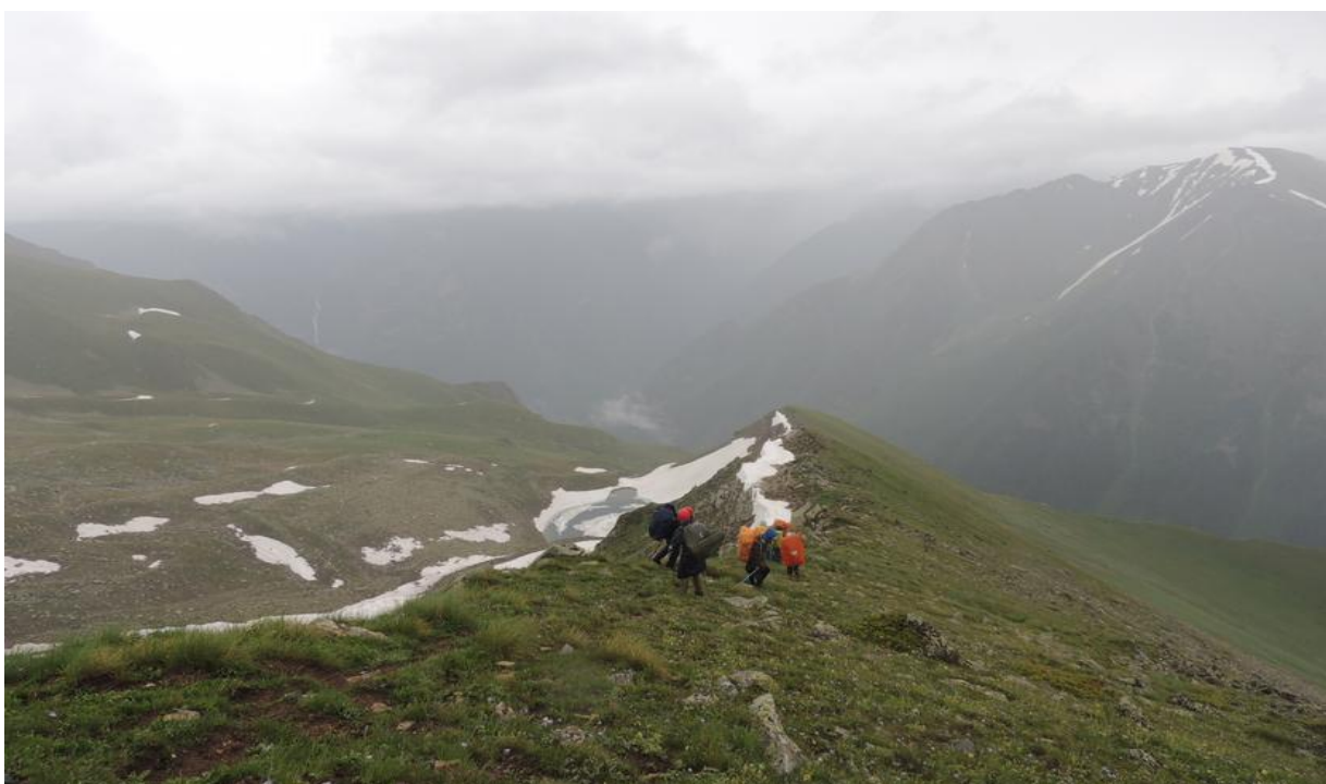
Фото 7. Спуск по гребню.

Съев шоколад и оставив записку в 14:20 принимаем решение — обед не готовить, спускаться вниз. Решение было продиктовано промозглой погодой на перевале. В 14:30 начинаем спуск. От перевала на водораздельный гребень ведет малозаметная тропа, спускаемся по гребню. Примерно через час выходим на хорошо набитую тропу ведущую на юго-запад к кошу. Через кош спускаемся по тропе к р. Махар. Примерно в 18:30 встаем на ночевку.