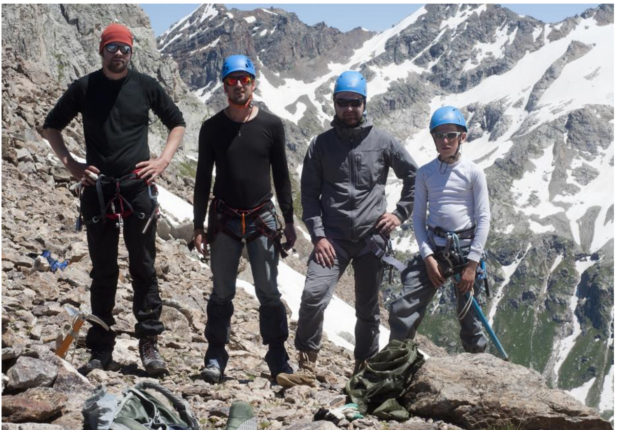
Фото 25. На перевале Техника Безопасности