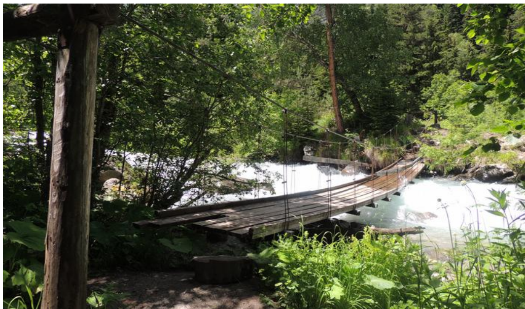
Фото 8. Мост к минеральным источникам

Встали в 7:00. Погода отличная — сушим вещи. В 11 часов выходим по дороге в сторону т/б Глобус. Через одну ходку добираемся до погранпоста, показываем пропуск и паспорта, нас записывают в журнал. Становится ясно, что спуск на 1100 м не прошел даром для ног Саши, даже без рюкзака он идет с трудом и крайне медленно, болят все мышцы бедер. В 13:30 делаем привал около источника минеральной воды. В 15:30 добираемся до т/б Глобус. Едим хычины и расслабляемся, обсуждаем, что делать если Саша идти не сможет. Вечером греемся в бане.