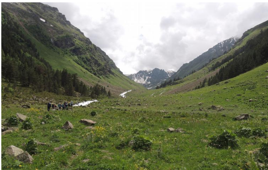
Фото 2. Вдоль р. Кичкинекол