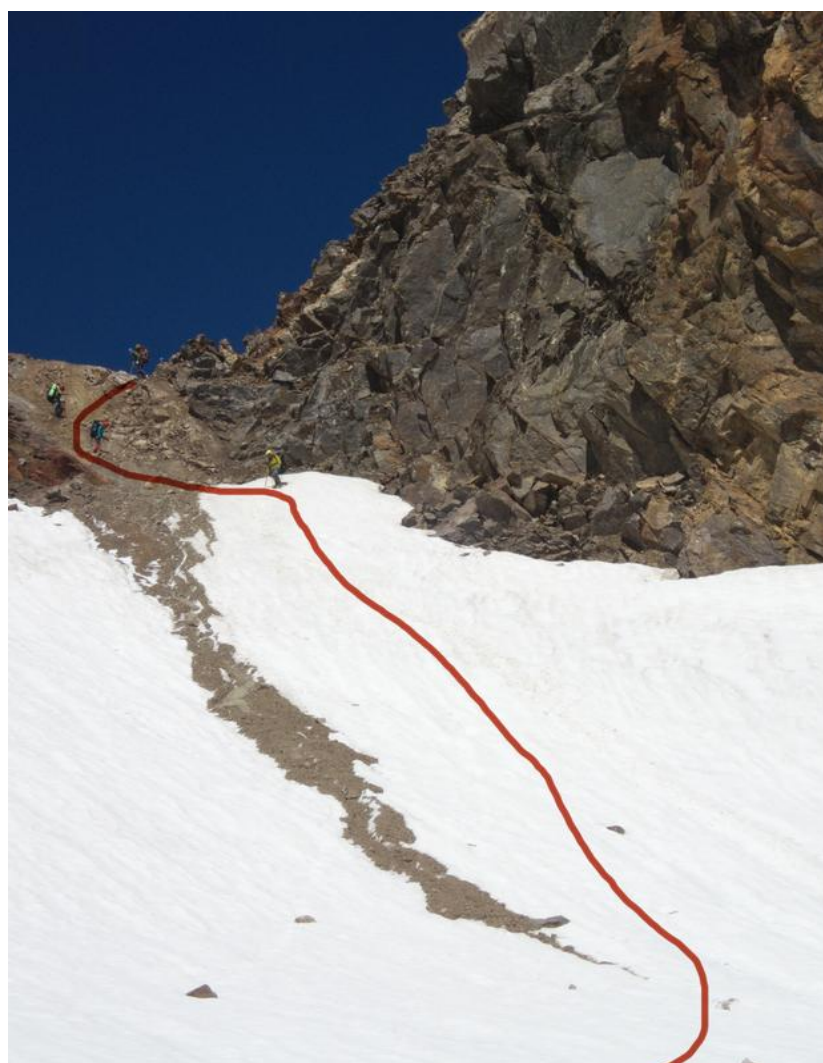
Фото 16. Оно же снизу