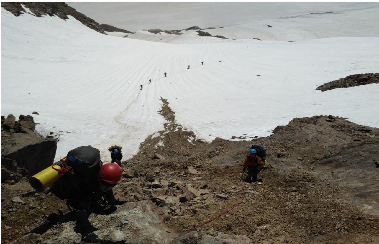
Фото 15. Начало спуска с перевала Ак-Тёбе