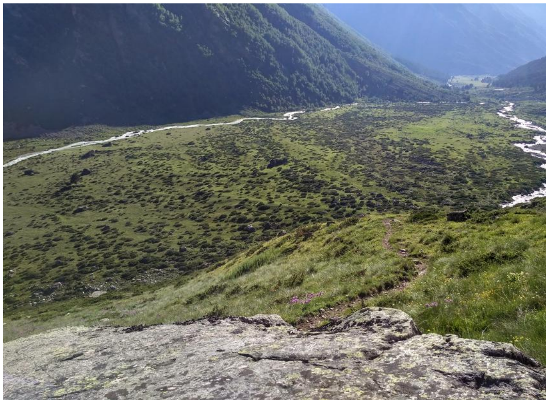
Фото 27. Исток реки Кубань (слияние Уллукама и Уллуозеня)

В 9:10 начинаем спуск к седловине перевала Хотютау. Спускаемся по сыпуче и скалам, скалы преодолеваются простым лазанием. В 9:45 мы спустились на перевал, сняли оставленную полчаса назад записку ПКТ и в 10:10 плотными группами спускаемся по сыпуче к леднику Большой Азау. Одеваем системы, кошки связываемся и в 11:00 начинаем движение по леднику в сторону оз. Эльбрусское. Местами ледник покрыт снежно-водяной кашей. В 14 часов выходим на моренные валы, снимаем кошки бухтуем веревки. Продолжаем движение по моренному валу и упираемся в открытую часть ледника. Одеваем кошки и в течении двух часов бродим среди трещин в поисках прохода, временами перекрикиваемся с группой ПКТ («У вас есть проход? Нет! У нас тоже...»). Прогулка по леднику надоедает — опять достаем веревки и, связавшись, переходим трещины по снежным мостам. В 16:00 выходим к оз. Эльбрусское. Встаем на ночлег.