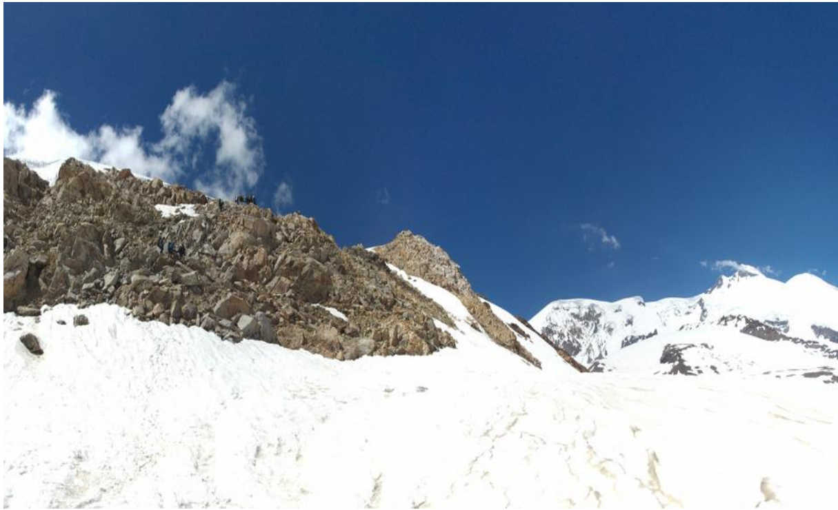
Фото 31. Спуск с пер. Хотютау на лед. Бол. Азау