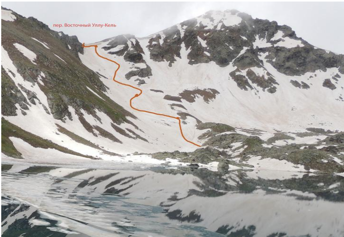
Фото 4. Путь подъема на пер. Восточный Уллу-Кель.