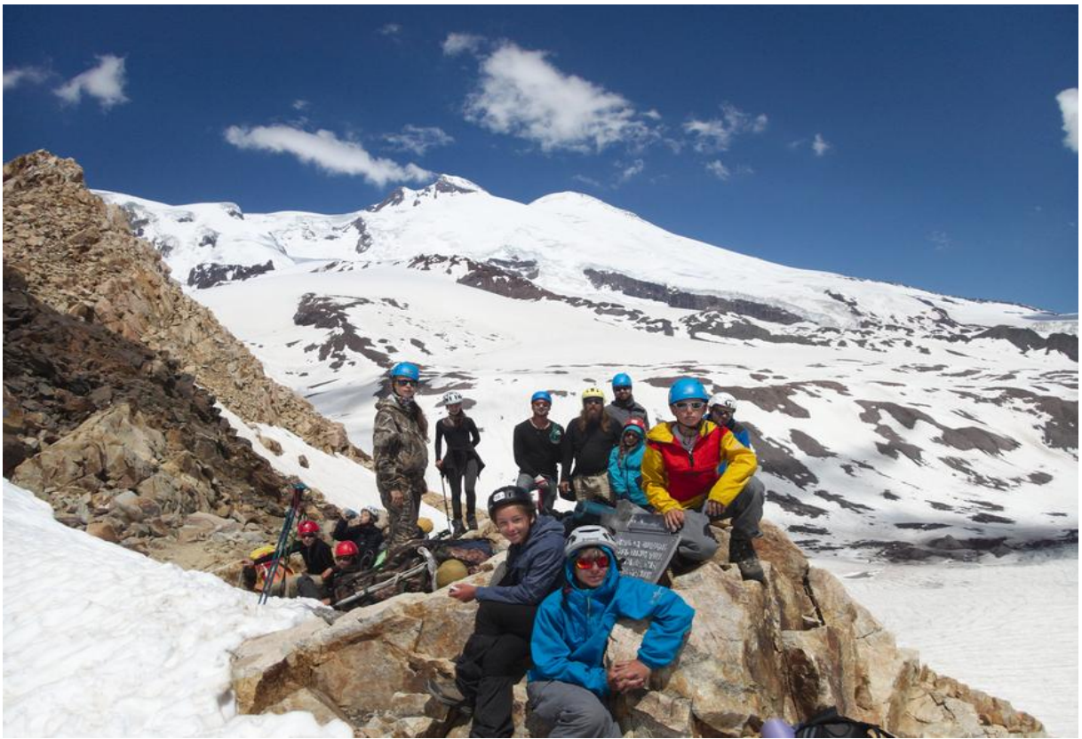
Фото 30. На пер. Хотютау