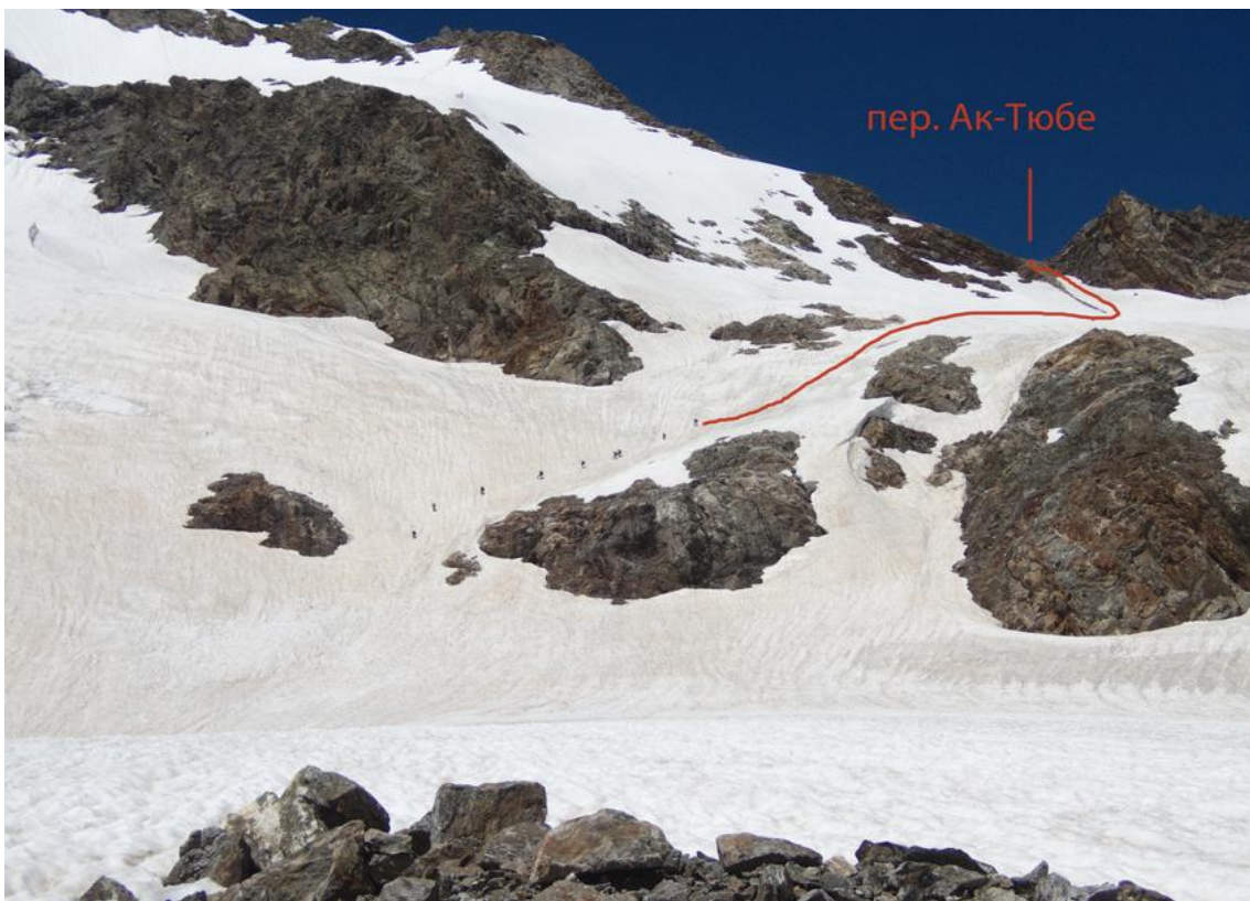
Фото 17. Путь спуска с перевала Ак-Тёбе на ледник Мырды