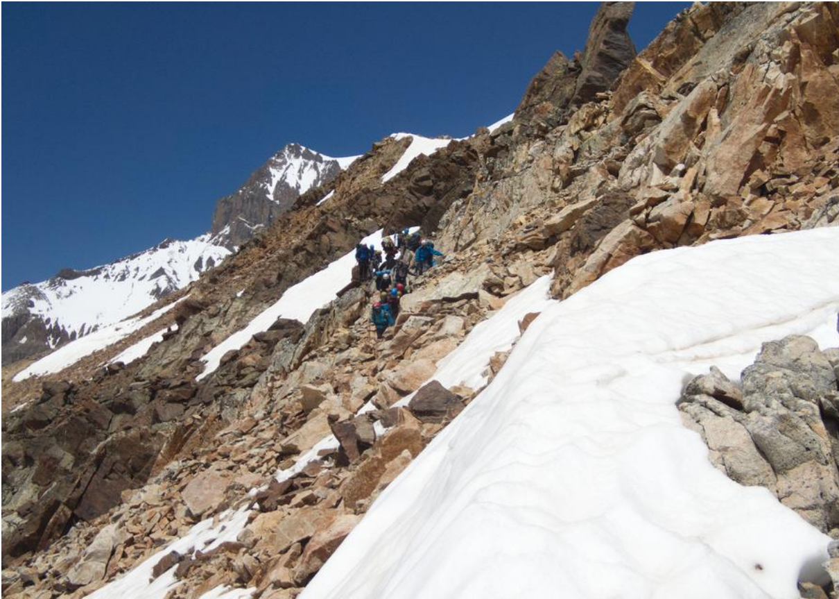
Фото 29. Спуск по гребню к пер. Хотютау