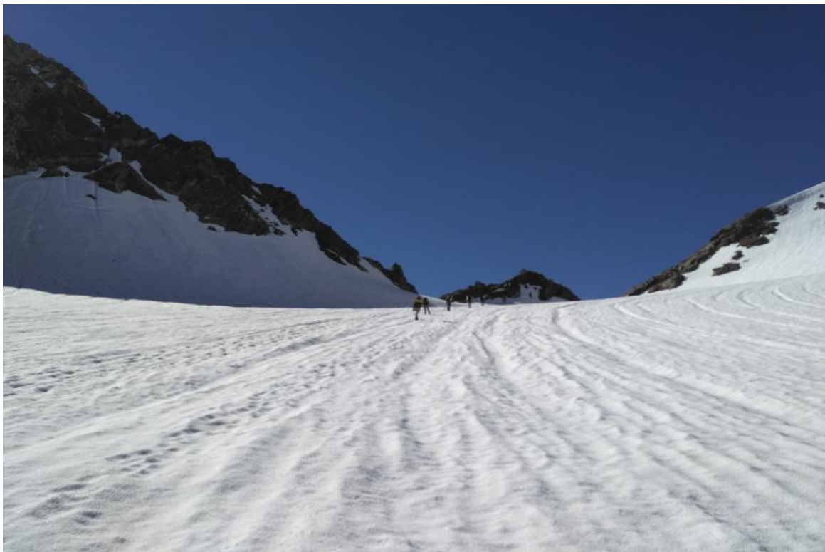
Фото 13. Движение по закрытой части ледника.

Подъем в 3:30. Погода наладилась — ясно и легкий морозец. Выходим в 5:00. За 15 минут доходим от стоянки до начала ледника, ледник в начале открытый. Одеваем кошки и по открытой части ледника доходим до снега. Связываемся и в 6:30 начинаем подъем по закрытой части ледника. Ледник покрыт толстым слоем снега, трещин не наблюдается, крутизна около 20°. В 7:30 подходим к перевальному взлету. Крутизна взлета около 30°. Поднимаемся по правой, более пологой части взлета и траверсируем взлет налево в сторону седловины в 8:00 мы на перевале. Сняли записку группы туристов из г. Армавир под руководством Роньжина А.А. от 6 июля.