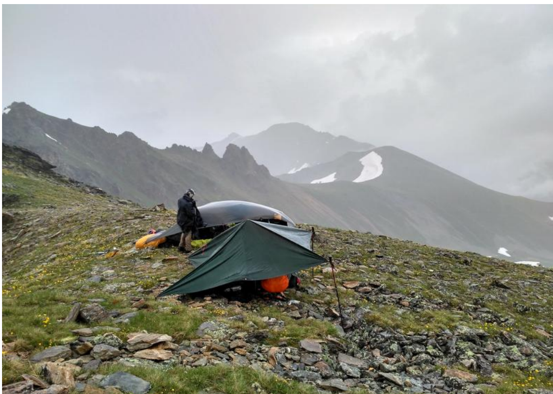
Фото 6. На перевале Вост. Уллу-Кёль.