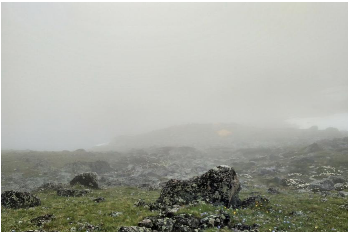
Фото 3. Видимость не очень.