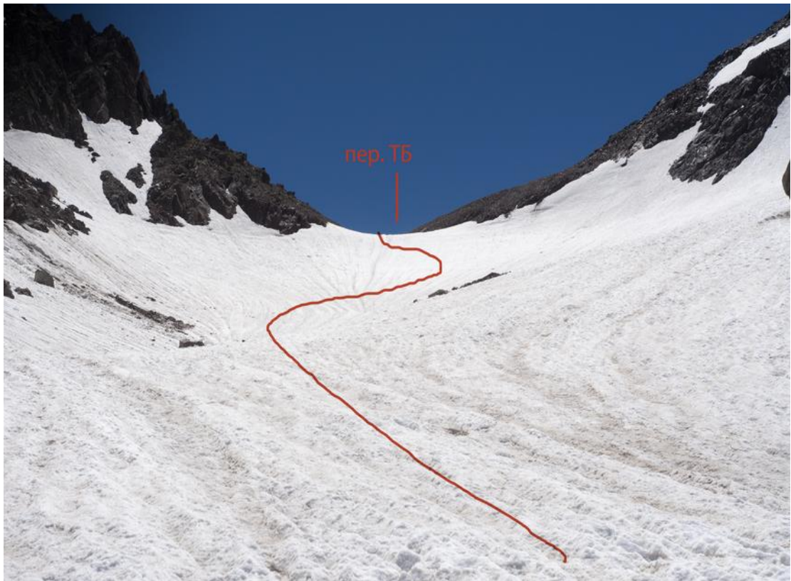
Фото 24. Подъем на перевал Техника Безопасности.