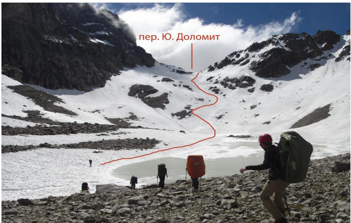
Фото 20. Перевал Доломиты Южный.

Проснулись в 3:00 опять моросит дождь. Спали до 7:00, погода наладилась. Вышли в 8:30. Обошли озеро с левой стороны, начали подниматься на перевал Доломиты Южный. Подъем по не очень крутому снежному склону, самострахуемся палками. В 11:05 на перевале. Сняли записку группы Mountain Auhinio г. Москва от 11 июля. (они шли навстречу и стояли рядом с нами на озере)