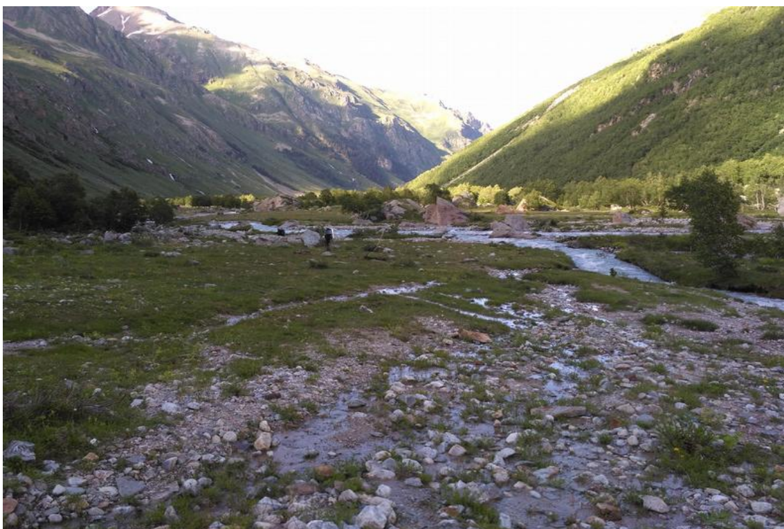
Фото 18. Долина р. Мырды