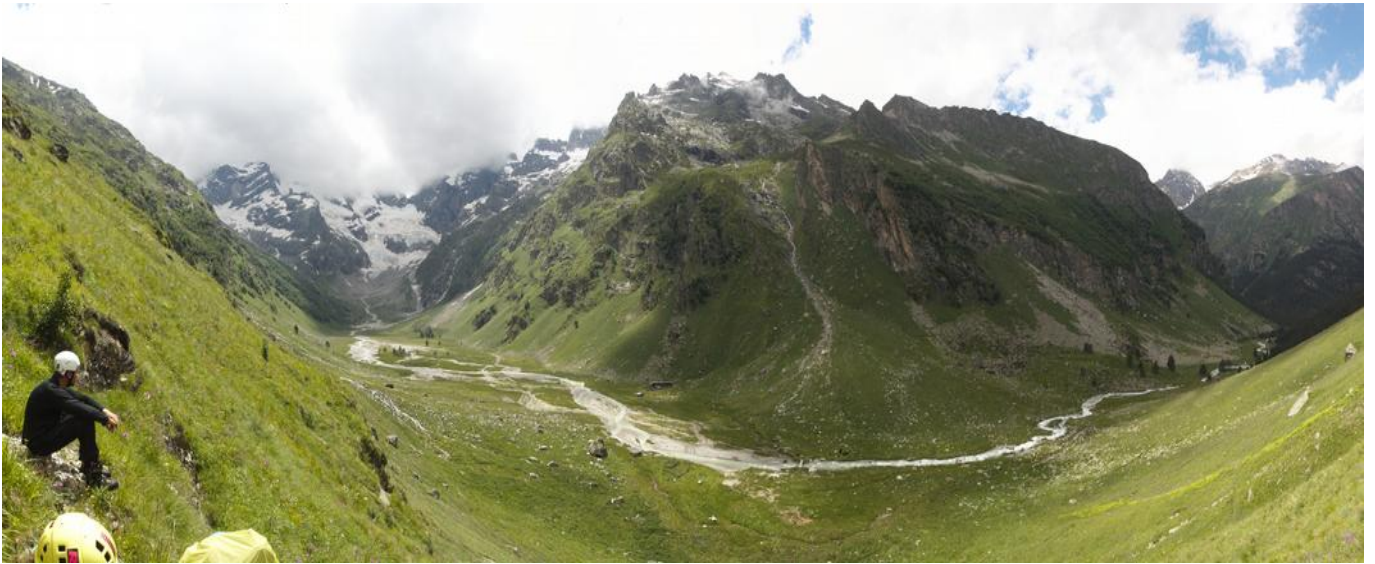
Фото 19. Привал на травянистом склоне на подходах к Доломитским озерам.