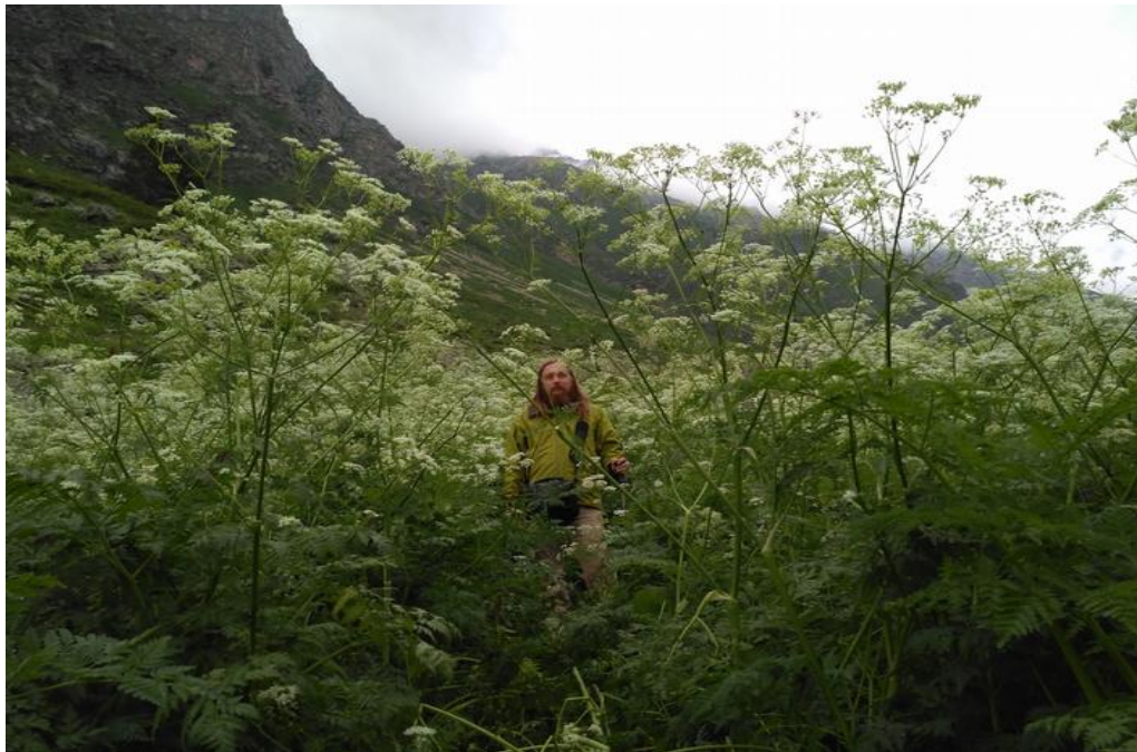
Фото 10. Растительность

В 8:40 начинаем подъем на моренный вал, ледник активно тает и приходится пересекать довольно неприятный ручей, идем в касках, самоотраховка палками или ледорубом. В 10 часов выбираемся на гребень моренного вала. Проходим по гребню, поднимаемся на бараньи лбы и встаем на обед в 11:15. В 14 часов доходим до основного ледника, идти на перевал и гору уже поздно, дальше уже и мы ставим лагерь. Вечером со стороны Абхазии появляются тучи. Ночью идет ливень.