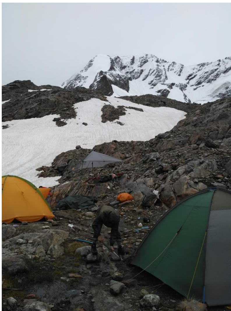
Фото 12. Борьба с водой.

Весь день идет дождь. Выше 3500 выпало немного снега. Окапываем палатки.