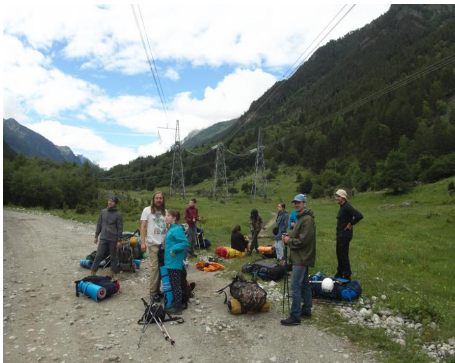
Фото 1. Старт

В 11:10 встаем на обед на высоте 2000 м, воду берем из реки. Обедаем полтора часа. Поднимаемся дальше, проходим мимо коша, в 17:10 разбиваем лагерь.